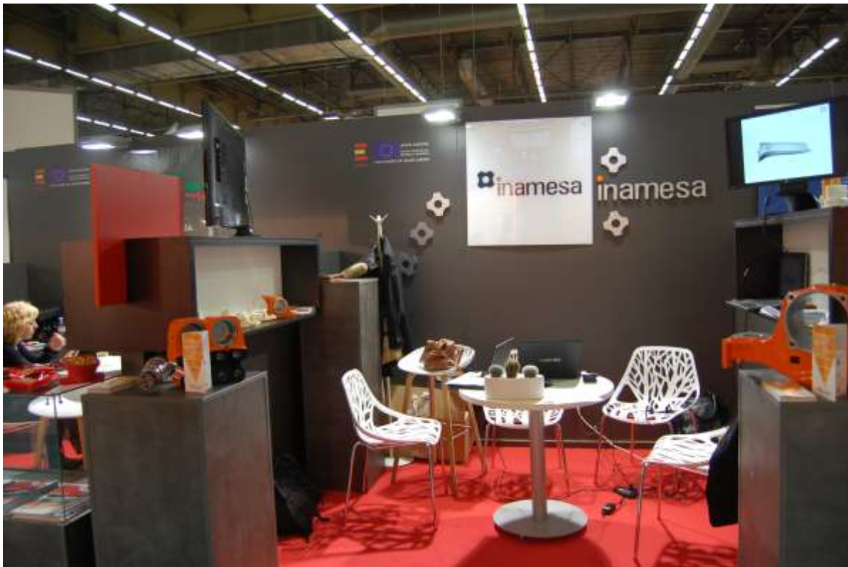
Stands básicos 9m 2 2015-2016